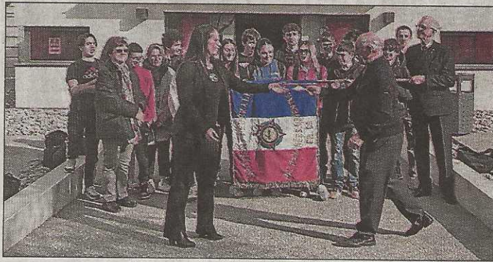
La remise de la subvention par la section fédérale André Maginot devant la Maternité d'Elne.