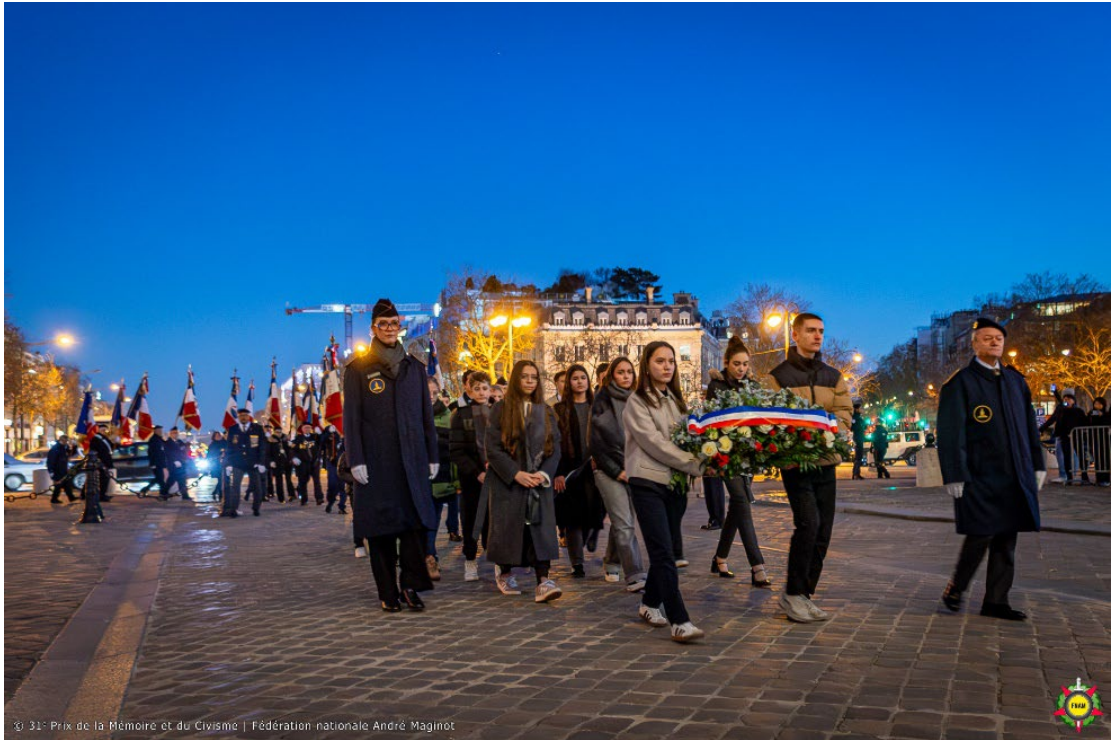
© 31 e Prix de la Mémoire et du Civisme | Fédération nationale André Maginot