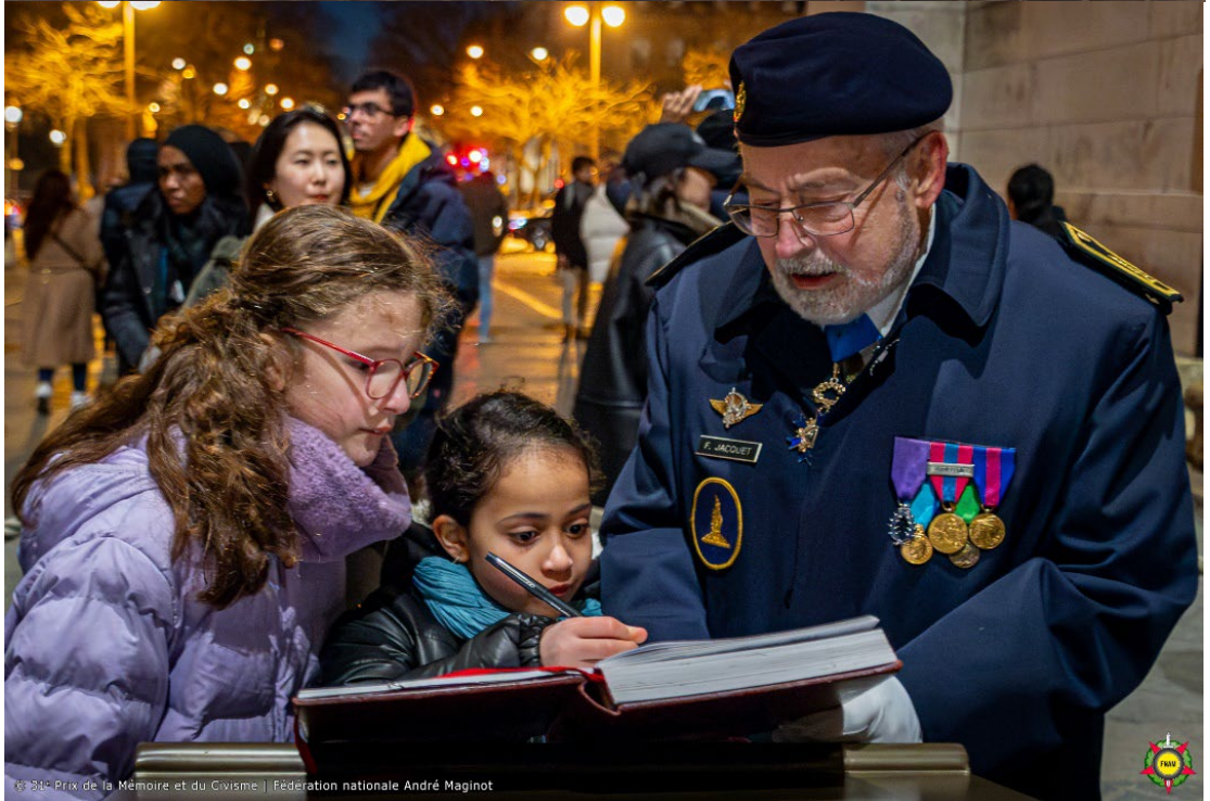
© 31 e Prix de la Mémoire et du Civisme | Fédération nationale André Maginot