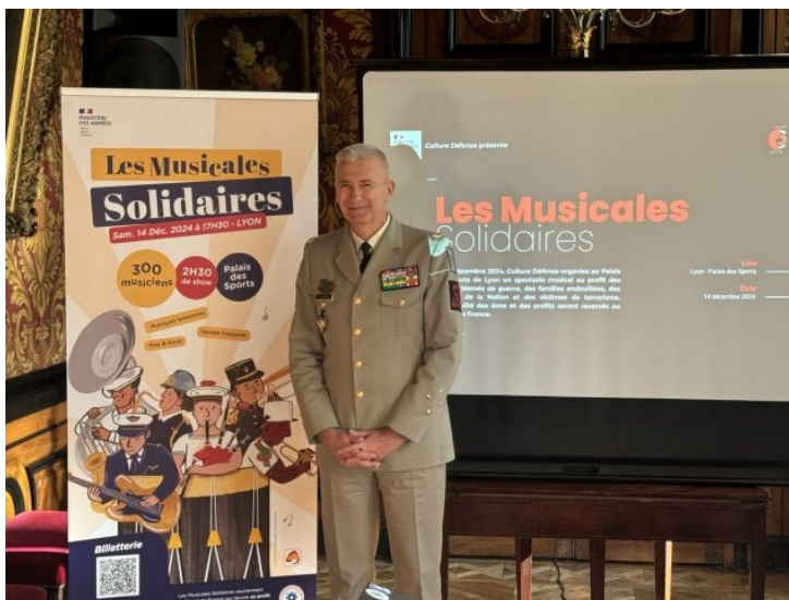
Général Denis Mistral, gouverneur militaire de Lyon

Tous les bénéfices générés par le festival ont été directement reversés au Bleuet de France afin de soutenir les blessés de guerre, les familles endeuillées, les pupilles de la Nation, ainsi que les victimes de terrorisme. Un appel aux dons sera également lancé lors de celui-ci.