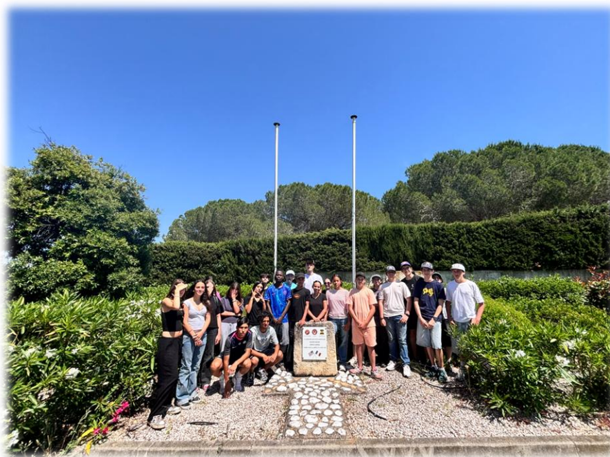
Collège des élèves de Georges Brassens près la stèle des TUSKEGEE AIRMEN

Les jeunes lattois se sont ainsi retrouvés près du Blockhaus situé sous le Mas Couran et sur celui qui se trouve sous le Mazeyrand, puis sur le site du mas des causses sur l'emplacement de ces radars allemands pour comprendre ce haut fait historique lattois.