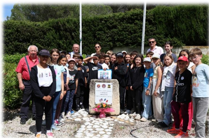
Élèves de l'école Port Ariane de Lattes sur la stèle des TUSKEGEE AIRMEN.