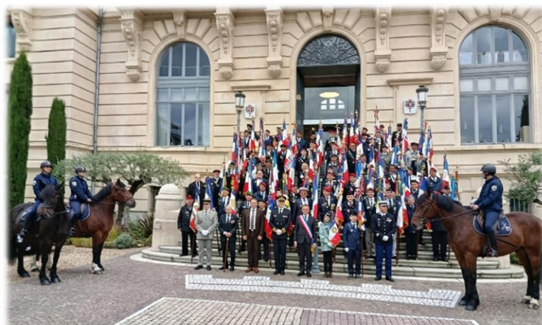
Les représentants du GR189